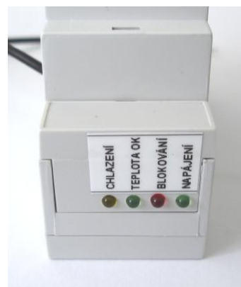
Obrázek č. 2: Regulátor chladicí skřínky